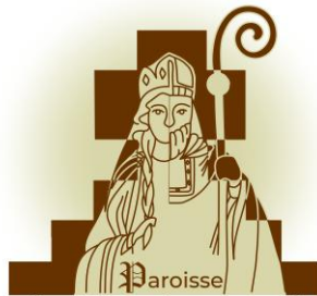
St Rémi - Ste Clotilde-en-Retz

15, route du Montcet-02600-Puiseux-en-Retz (Accès sente sur le côté de la maison)